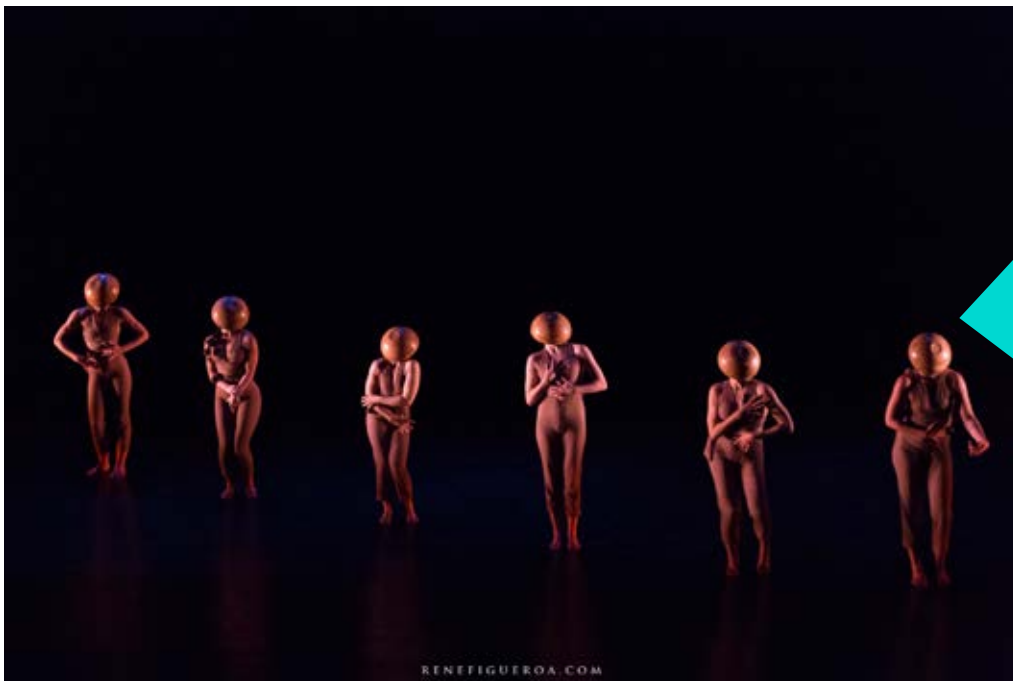
MAWU de Cia Aina Lanas de Barcelona, presentado en el Teatro Nacional de San Salvador.

A través de convocatorias nacionales e internacionales, el equipo organizador escoge a un artista que pueda generar un espacio de laboratorio y creación para artistas locales en el transcurso de las tres semanas previas al inicio del festival. Luego de cuatro años, Nómada ha experimentado 3 residencias y 1 espectáculo de gran formato, teniendo experiencia con artistas de la talla del Suizo Angelo Dello Icono (Suiza/ Italia) quien crea “Urban Shaman” (2017) y “No Plan B”(2018) esta última es una fusión entre Ben Swchwendener (USA) y la empresa de Angelo ADN Dialect. En ambas producciones más de 30 artistas de varias técnicas se unieron en escena. En 2019, Raúl Martínez dirige durante tres semanas el laboratorio/creación “Vuelo Absoluto”, para 2020 cerrar nuestra cuarta edición, el colectivo Tactiq (España/Francia) creó una pieza de formato para espacios públicos en una alianza con bailarines y bailarinas de la Compañía Nacional de danza a través del Ministerio de Cultura, así mismo, el festival contó con el espectáculo de gran formato “MAWU”, de la Cia Aina Lanas de Barcelona.